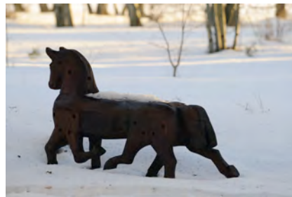
Sleipner , träskulptur

Mycket komplex fråga. Allt du nämner inspirerar mig på ett brett plan och finns som en kulturell referensyta, men det som sätter igång skapandet är att något berör mig. Det kan vara ett objekt/föremål, minnessak, en text jag läser, något jag ser eller hör. För mig måste det finnas en laddning som driver arbetet framåt, lite av att gå på slak lina. Det är upp- och utmaningen.