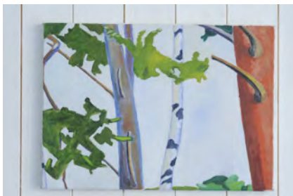
Detalj ur Hablingbosviten , olja

Jag började ju som målare men har ägnat en stor del av min konstnärliga gärning åt skulpturen. Nu ägnar jag mycket tid åt måleriet och det är naturen som oftast är i fokus.